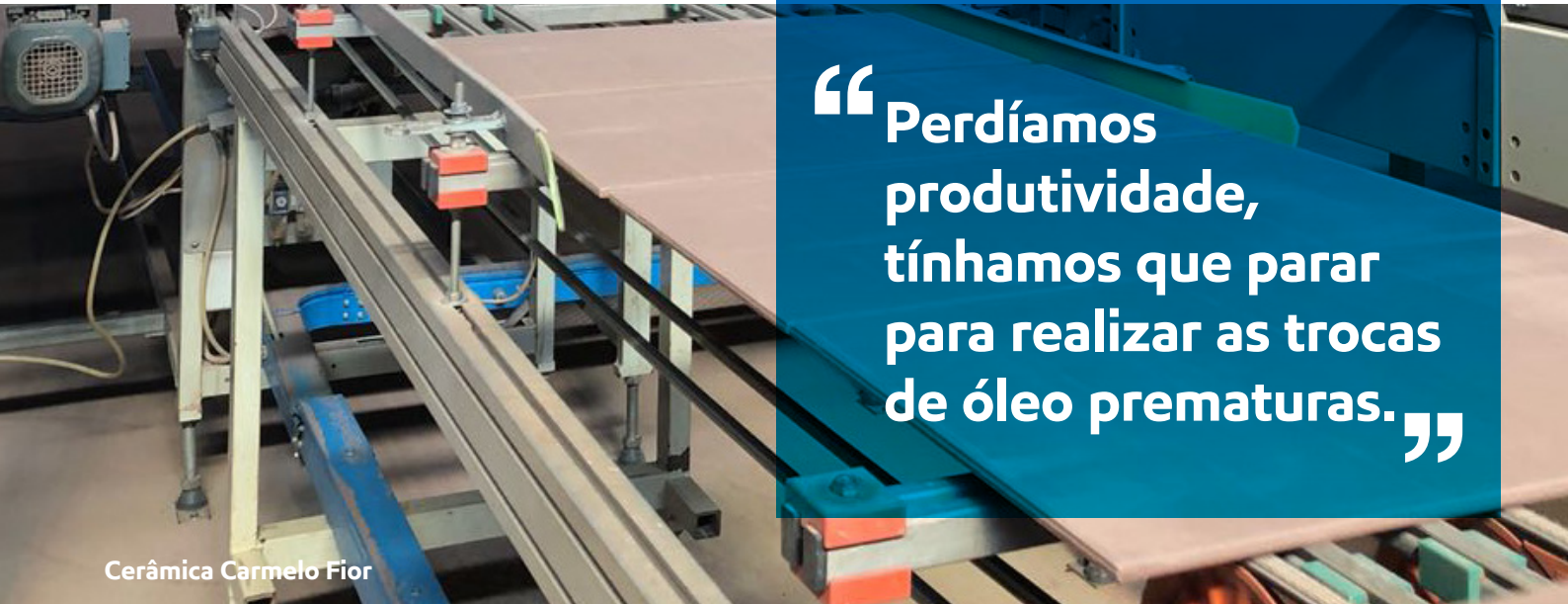
Cerâmica Carmelo Fior

trocar os filtros. Os radiadores entupidos elevavam a temperatura do sistema, aumentando vazamentos. Perdíamos produtividade, tínhamos que parar para realizar as trocas de óleo prematuras”, ele explica.